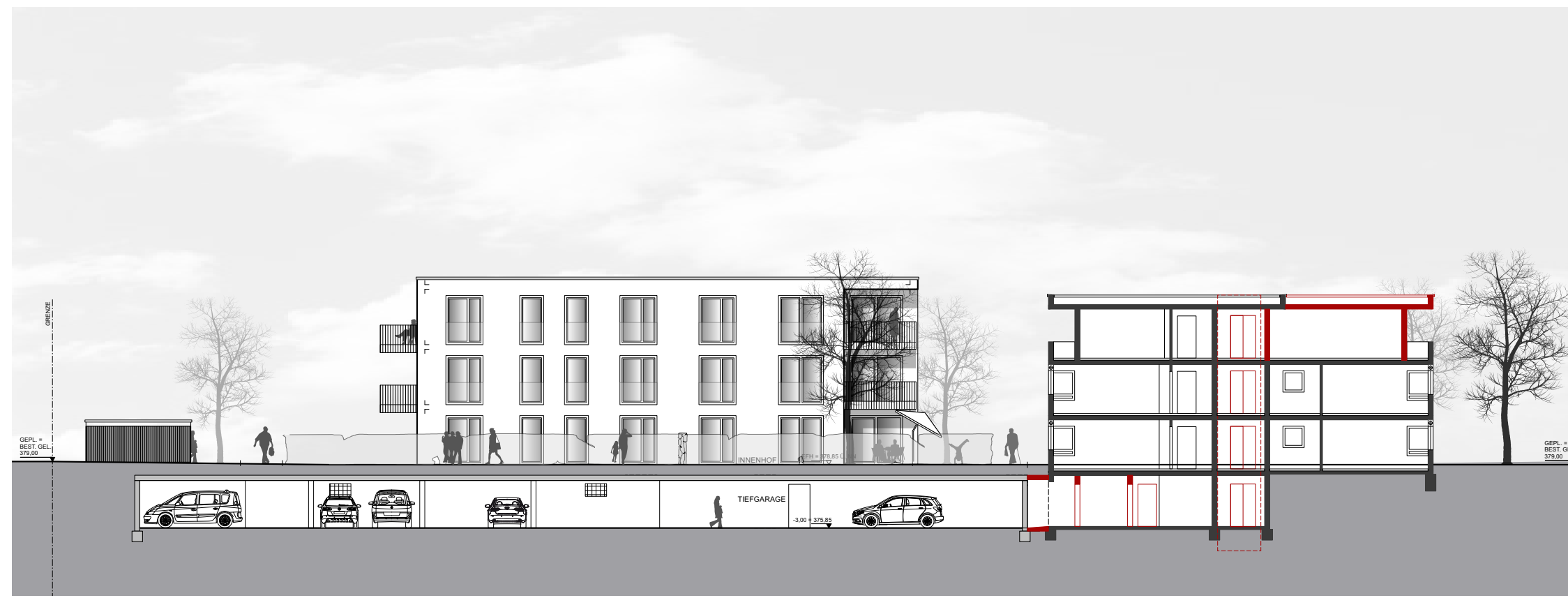
Schnitt und Ansicht C-C Maßstab 1:250