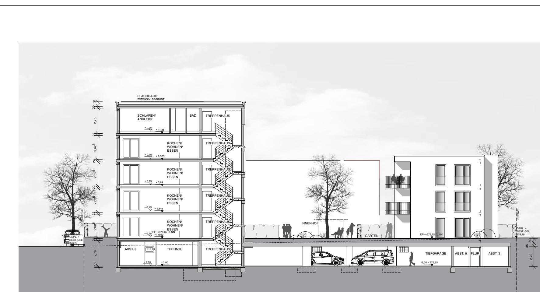
Schnitt und Ansicht B-B Maßstab 1:250