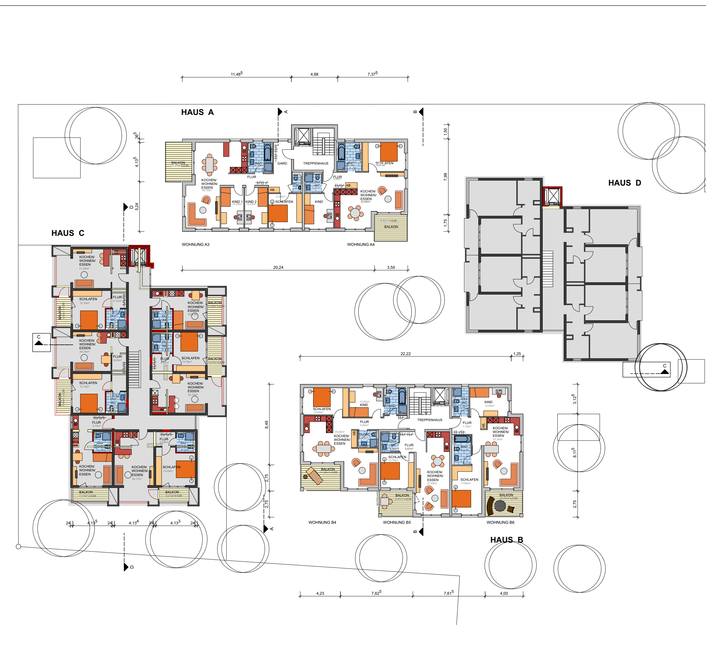
Grundriss OG Maßstab 1:250