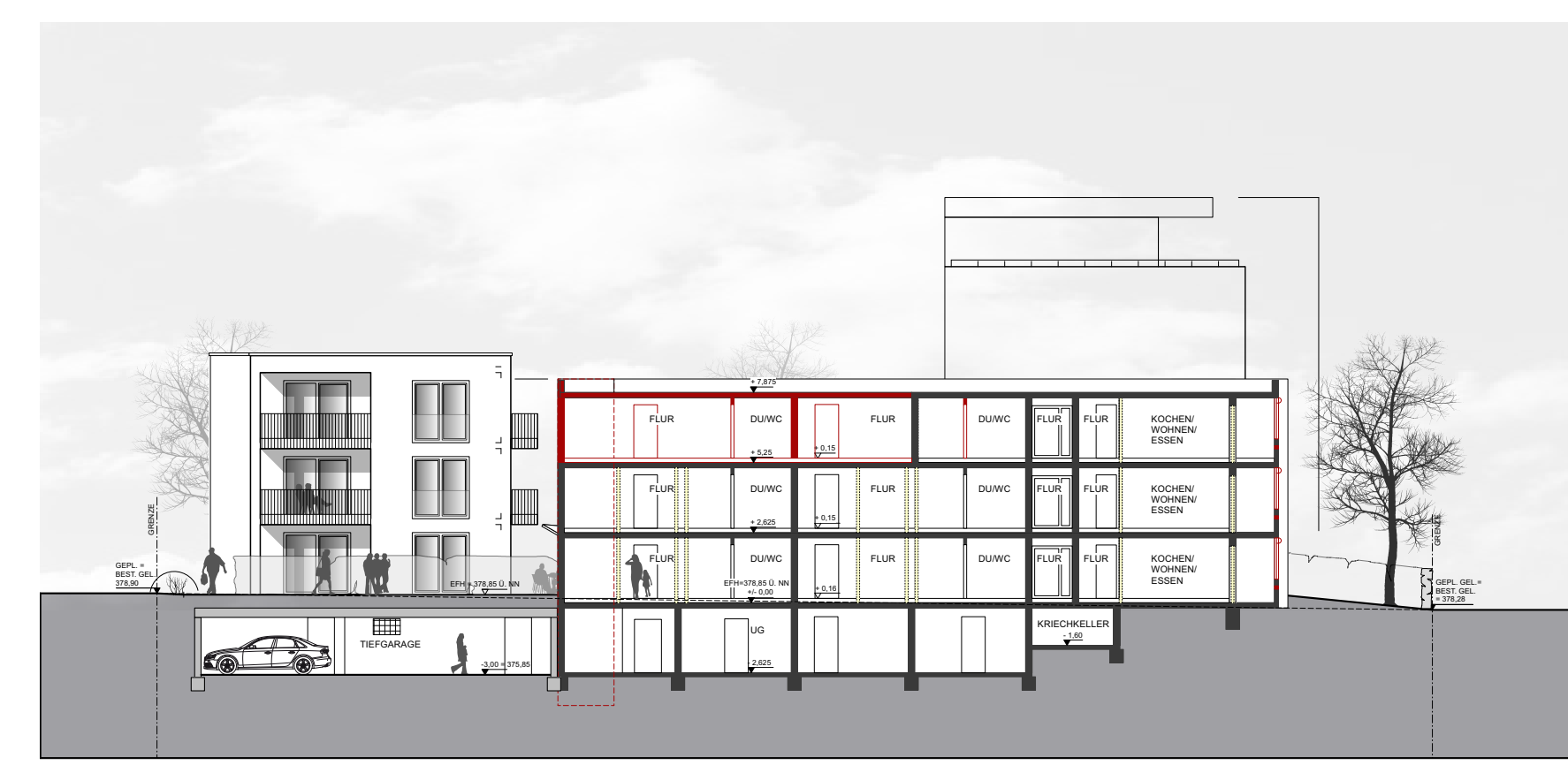
Schnitt und Ansicht D-D Maßstab 1:250