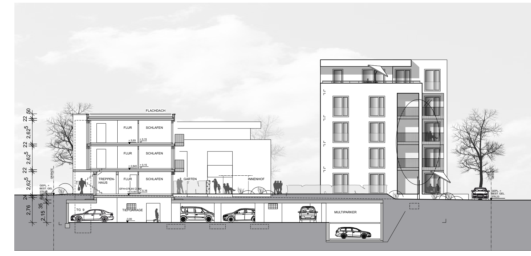
Schnitt und Ansicht A-A Maßstab 1:250