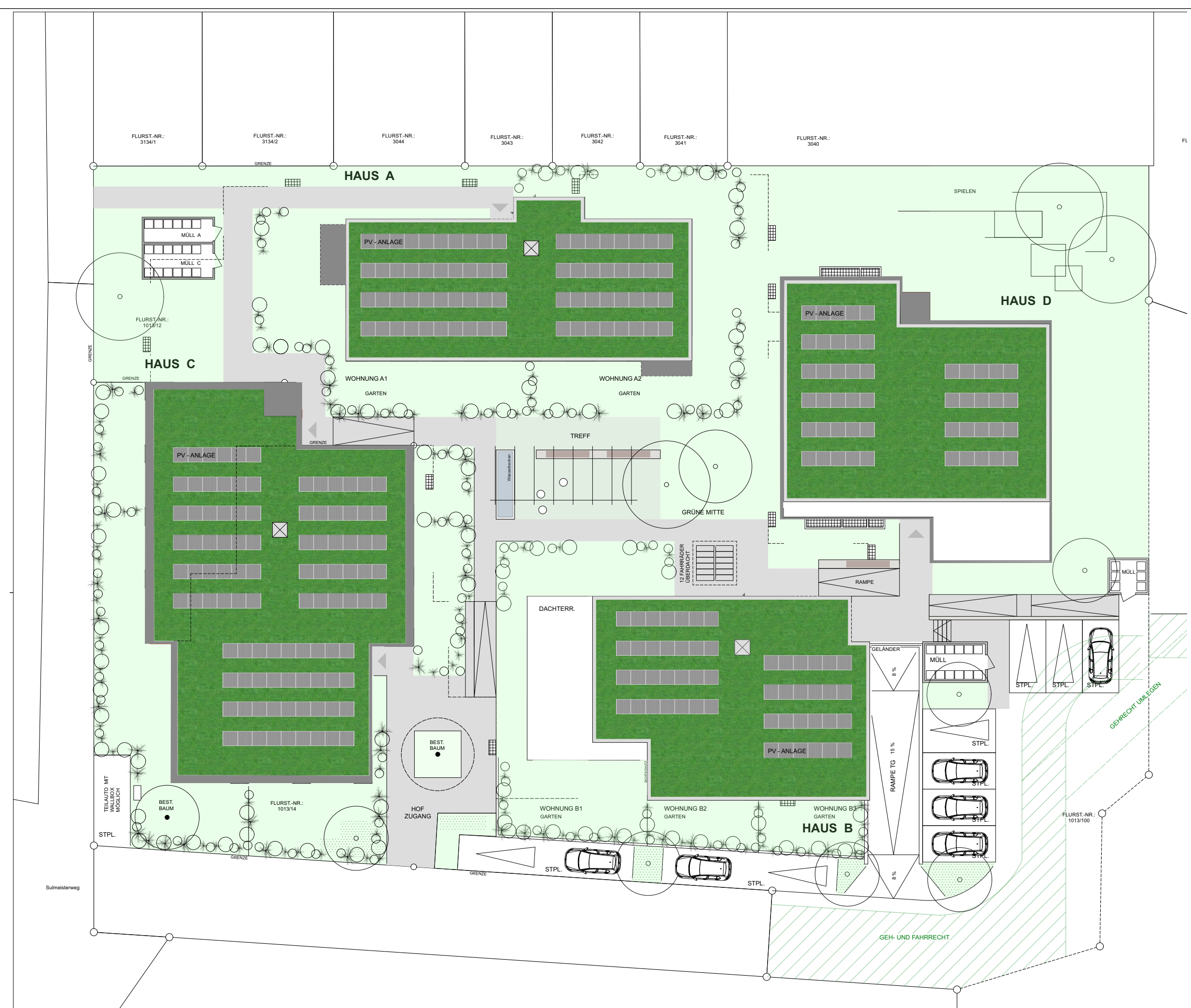
Aussenanlagen Maßstab 1:250