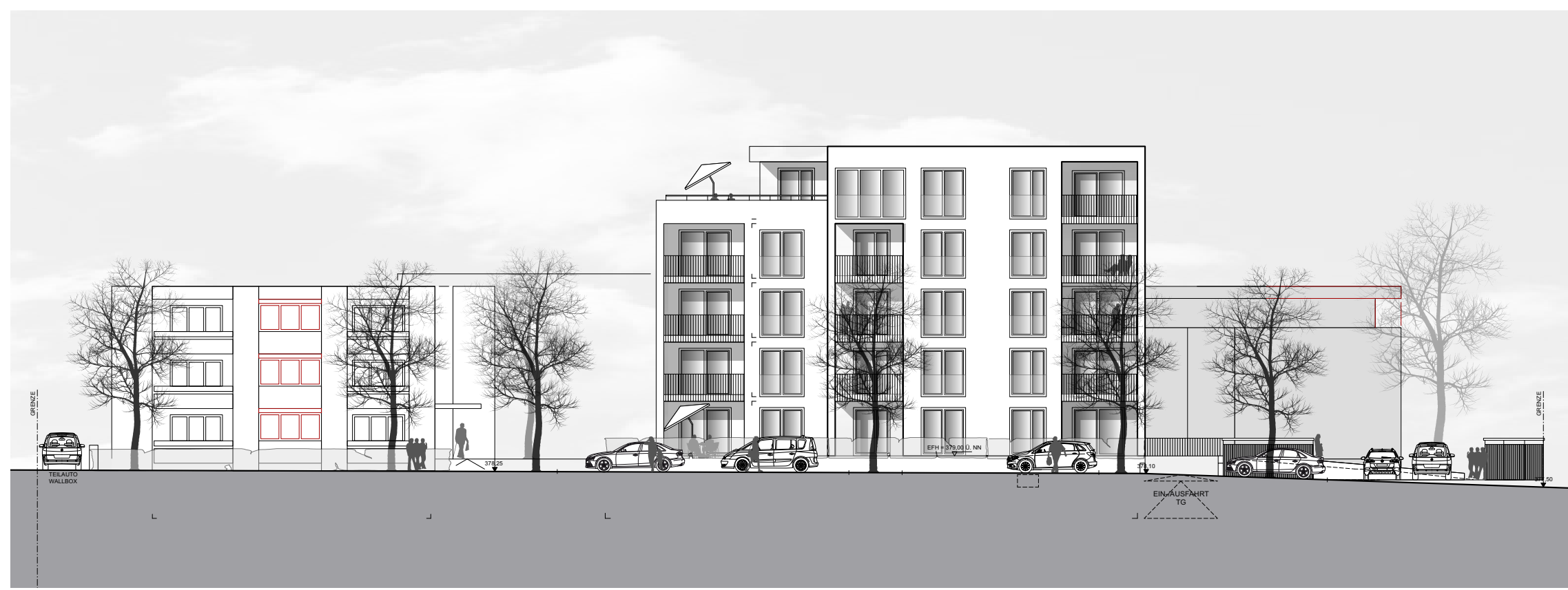
Ansicht E-E Maßstab 1:250