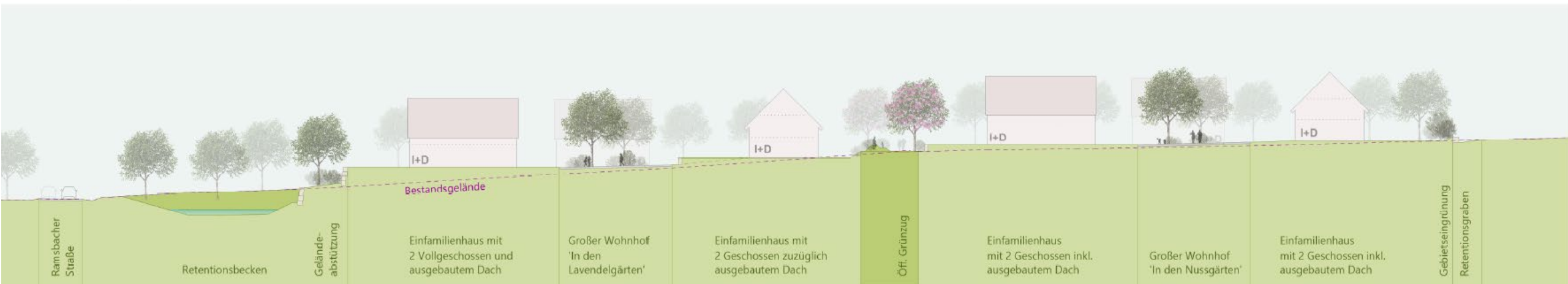
Schnitt Süd-Nord 1