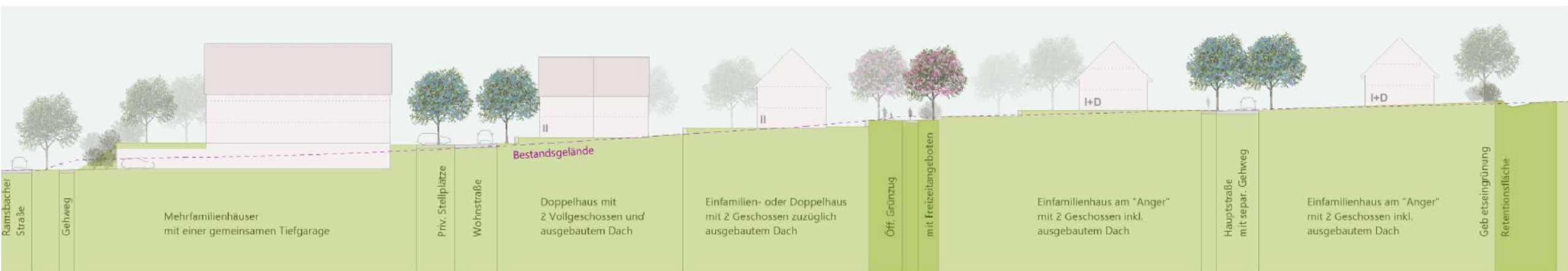
Schnitt Süd-Nord 2