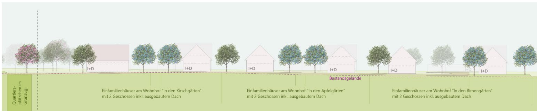
Schnittansicht West-Ost (östlicher Abschnitt)