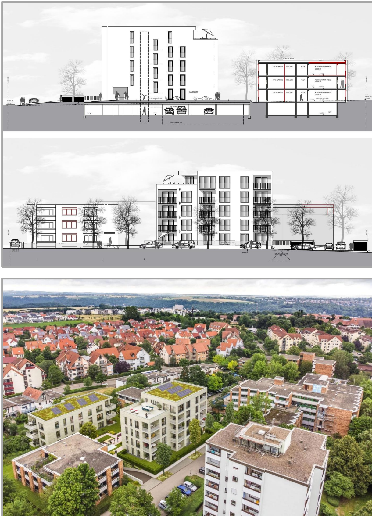
Abbildung 5+6: Ansichten und Visualisierung, unmaßstäblich Auf der Grundlage der genannten Planungserfordernisse, Planungsziele und situationsbedingten besonderen Voraussetzungen sind für das