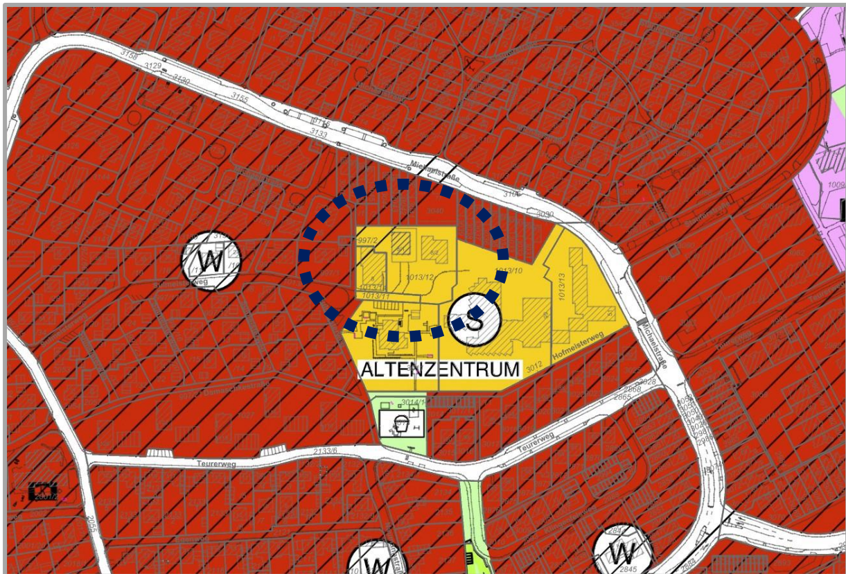
Abbildung 3: Ausschnitt Flächennutzungsplan, unmaßstäblich

auszuweisende Grundfläche deutlich weniger als 20.000 m 2 beträgt. Dies schon allein deshalb, weil das Plangebiet nur eine Größe von ca. 0,4 ha aufweist. Aufgrund des Verfahrens nach § 13a BauGB sowie im Hinblick auf die bestehende und geplante Nutzung ist der Flächennutzungsplan in diesem Bereich aber lediglich zu berichtigen.