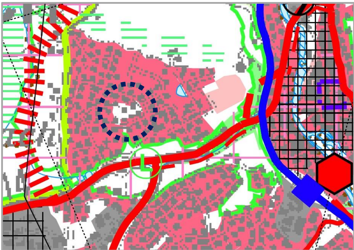
Abbildung 2: Ausschnitt Regionalplan, unmaßstäblich

Im Regionalplan der Region Heilbronn–Franken 2020 ist Schwäbisch Hall als Mittelzentrum im Süden der Region ausgewiesen und liegt im Schnittpunkt der Landesentwicklungsachsen von Stuttgart bzw. Heilbronn nach Würzburg und Nürnberg. Die Stadt ist Teil des Verdichtungsbereichs im Ländlichen Raum und als Siedlungsschwerpunkt definiert. Der Stadtteil Teurershof / Heimbachsiedlung ist dabei bereits als Siedlungsbereich Wohnen dargestellt und auch das Plangebiet zählt zum bereits besiedelten Bereich. Angrenzend an den Stadtteil sind die Landschaftsschutzgebiete „Talhänge um Schwäbisch Hall“ im Süden, „Ostabfall der Waldenburger Berge“ im Westen und „Kochertal zwischen Schwäbisch Hall und Weilersbach“ im Osten sowie nördlich ein regionaler Grünzug dargestellt. Die westliche Ortsumfahrung, welche bereits hergestellt ist, ist dort noch als geplante Trasse ausgewiesen. Siehe dazu auch Abbildung 2.