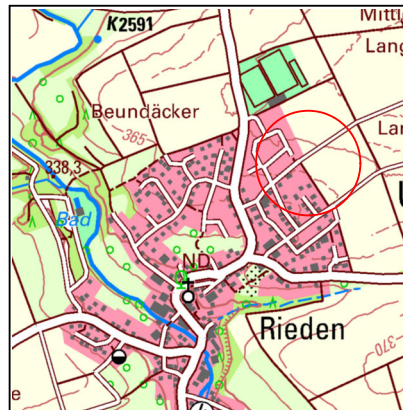
Topografische Karte 1:20.000