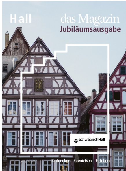
Jubiläumsausgabe Hall – das Magazin