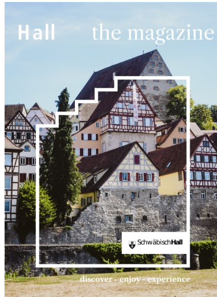
Englische Ausgabe Hall – das Magazin