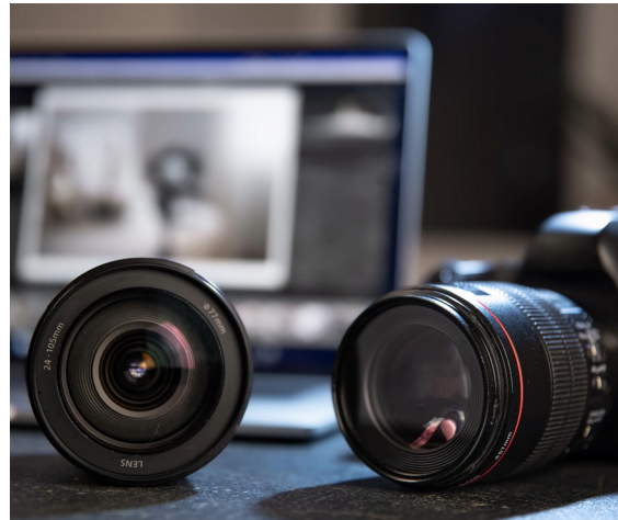
Foto & Bewegtbild von Kulturveranstaltungen