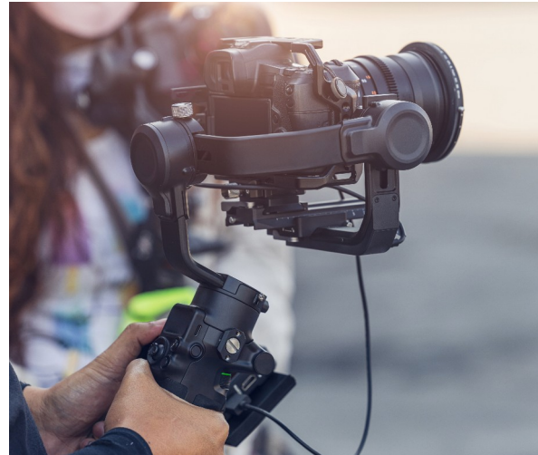
Foto & Bewegtbild für Kongress- und Wirtschaftseinrichtungen