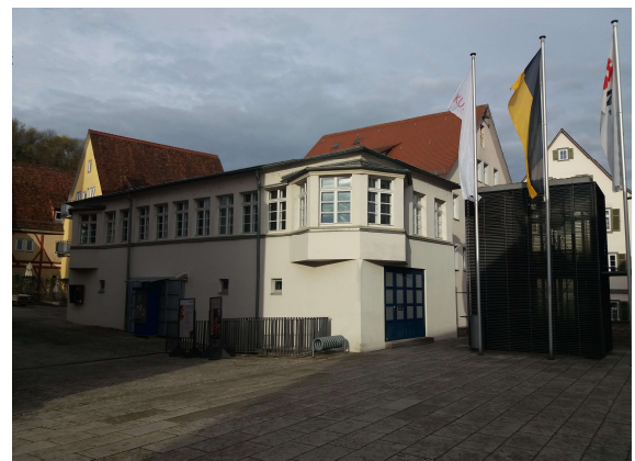
Abb. 3 und 4: Blicke über die südwestliche und nördliche Eingriffsfläche