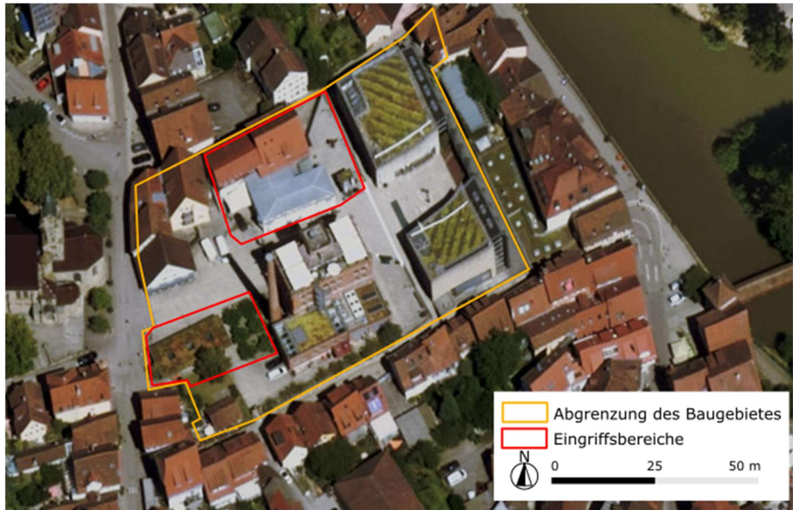
Abb. 2: Abgrenzung des Baugebietes und der Eingriffsbereiche (Kartengrundlage Luftbild)