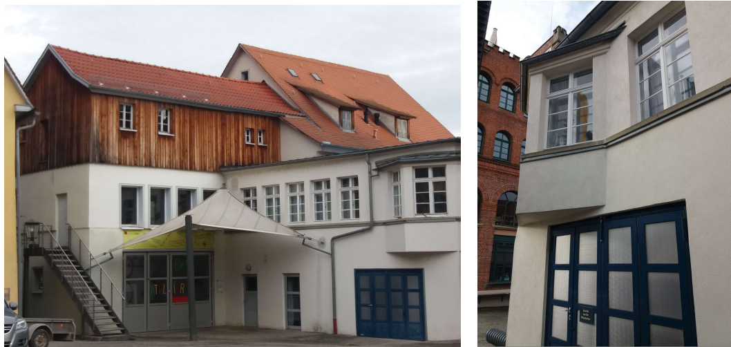
Abb. 5 und 6: mögliche Fledermaushangplätze

Auch die Gebäude werden aktuell (Frühjahr, Sommer, Herbst) nicht von Fledermäusen genutzt. Die Öffnungen im unteren Abschluss der Boden-Deckel-Schalung an der westlichen Fassade sowie eine Aushöhlung unter Dachrinne der östlichen Fassade der nördlichen Gebäude sind jedoch als Ruhestätten für einzelne Fledermäuse geeignet.