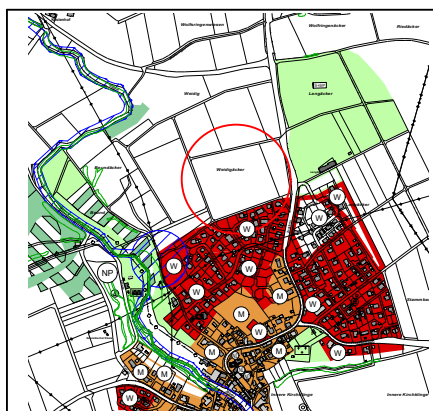
Bish. Fassung FNP 7D 1:20.000