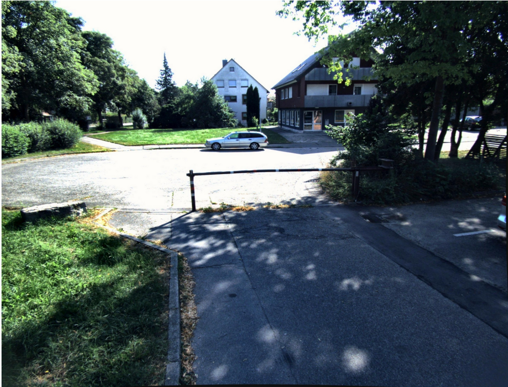
Abbildung 4: Schrankenanlage zwischen Wendehammer Elisabethenstraße und Parkplatz Kindergarten zur Vermeidung von Durchgangsverkehr und Konflikten mit Kindergarten