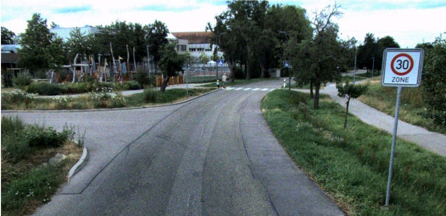
Abbildung 2: Beginn ZONE 30