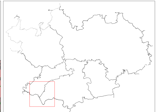
Lage in der VVG