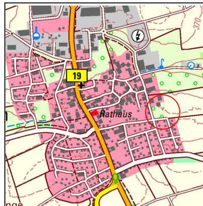
Topografische Karte 1:20.000